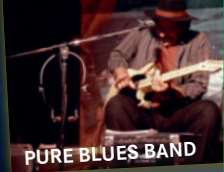
PURE BLUES BAND